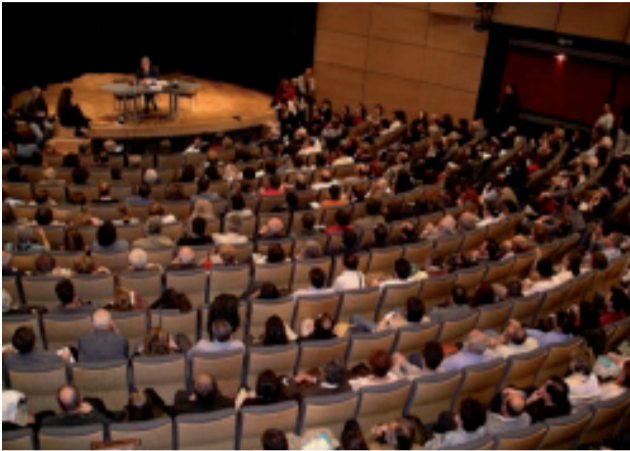
Institut Français d'Athènes